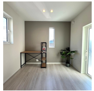
④フリースペースは書斎として使用