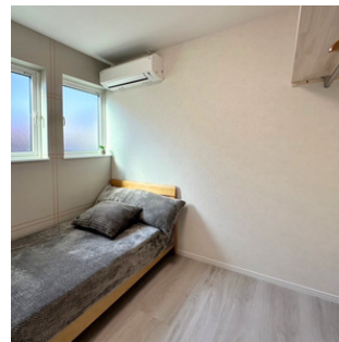
③各洋室にはオープンクローゼットを設置